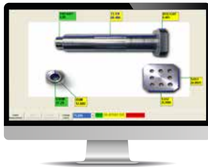
量測結果視覺化與狀態顯示