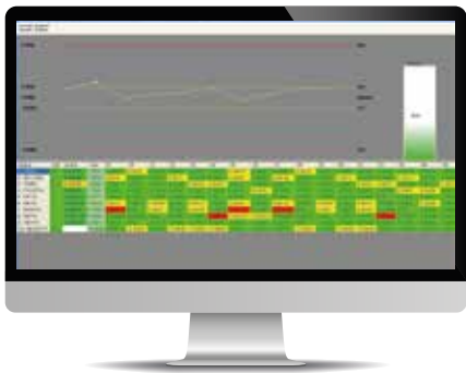
簡易與直覺的量測資料與刀具壽命管理